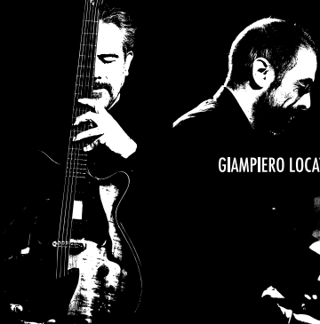
GIAMPIERO LOCATELLI / PIANOFORTE