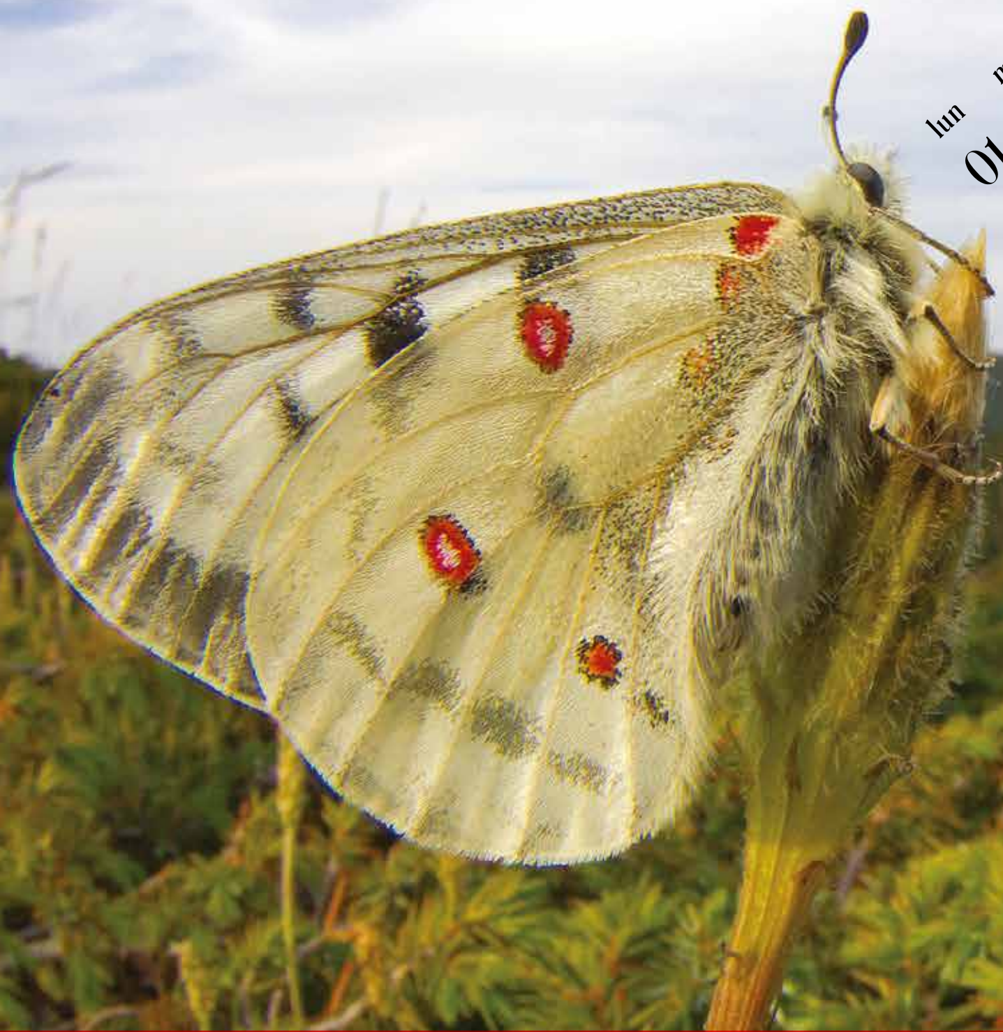
Farfalla apollo ( Parnassius apollo )

Elementi di biodiversità nel Parco Nazionale dell'Aspromonte