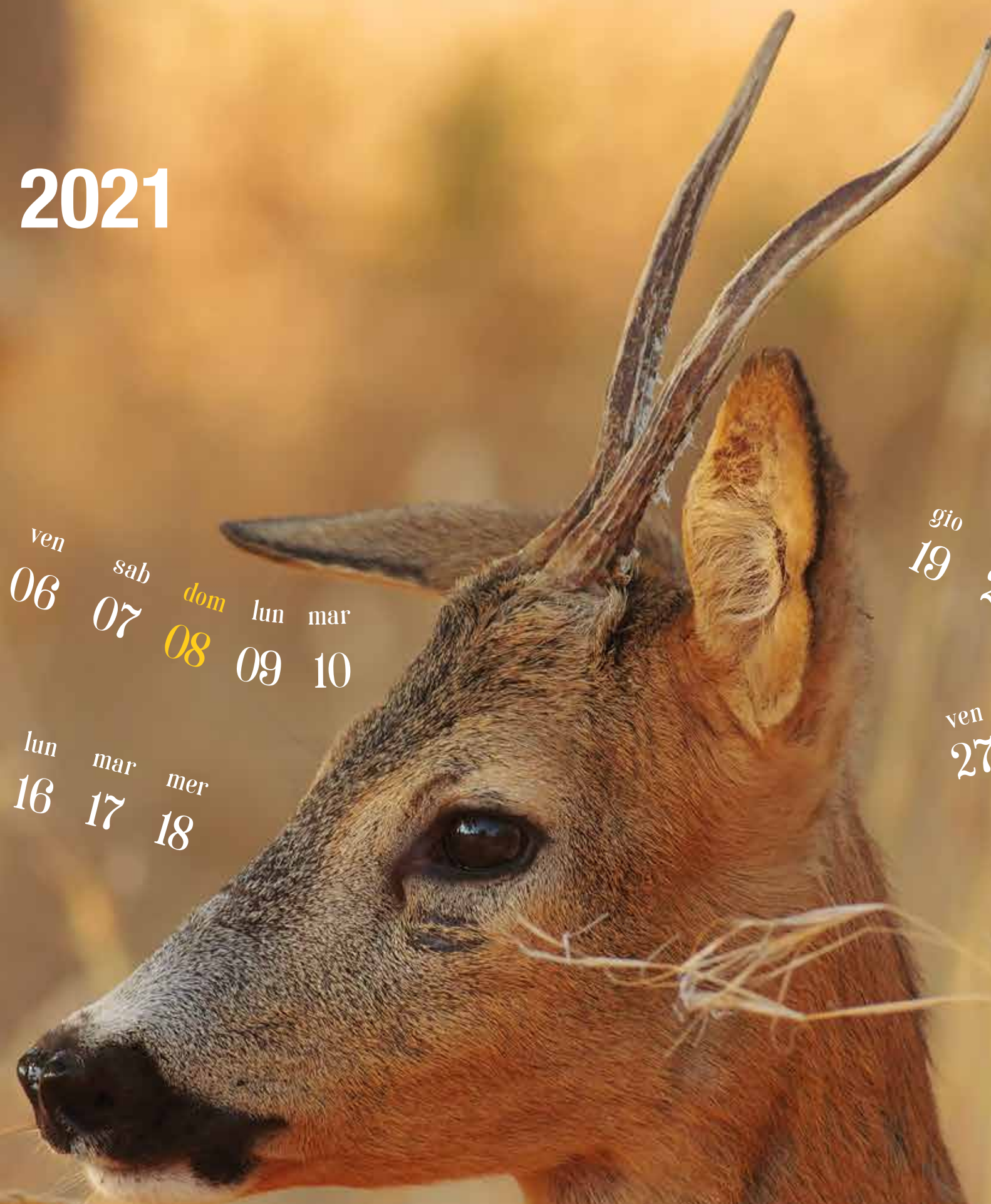
Capriolo ( Capreolus capreolus )

Elementi di biodiversità nel Parco Nazionale dell'Aspromonte