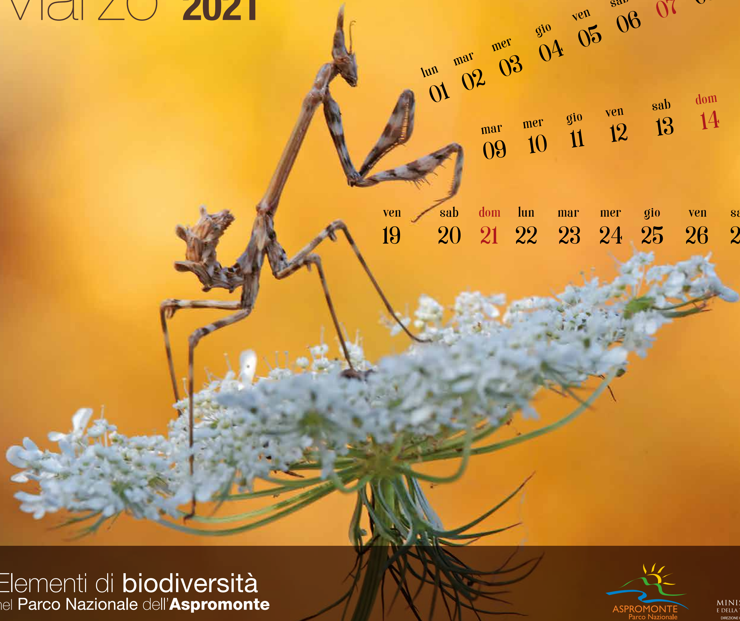
Empusa pennata

Elementi di biodiversità nel Parco Nazionale dell'Aspromonte